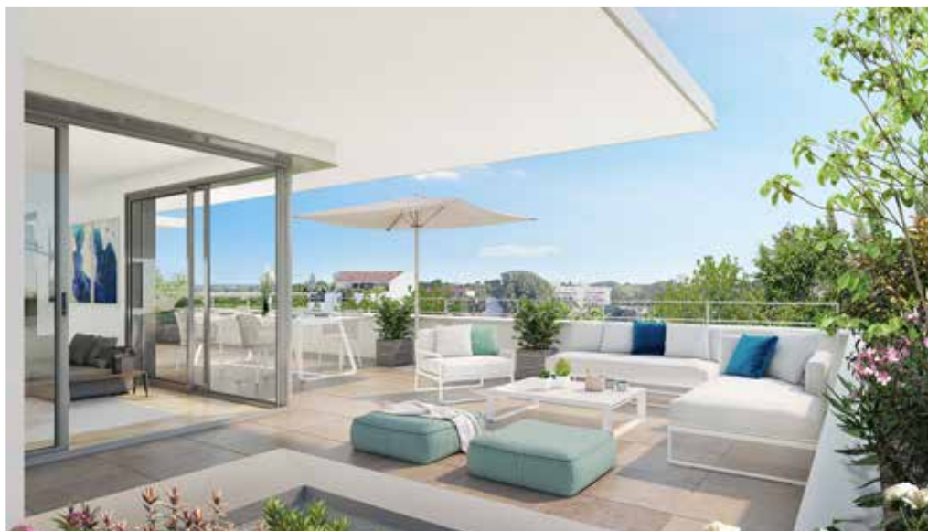
Terrasse généreuse, vue sur le parc. Appartement 204

Le parc de la résidence s'inscrit dans le prolongement d'un espace boisé classé, participant à la diversité du patrimoine végétal.